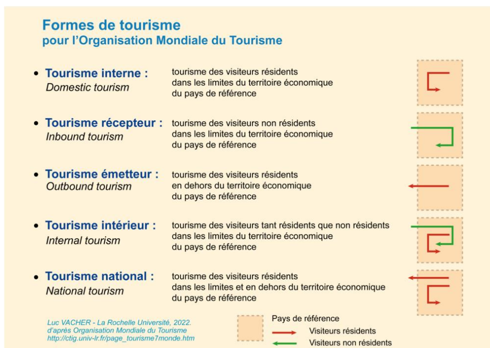
Figure 1 : Différentes formes de tourisme