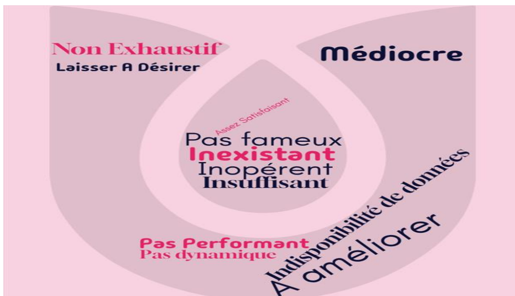
Figure 3 : Appréciation du système statistique du tourisme sénégalais (nuage de mots)