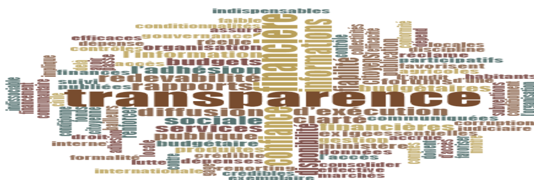
Figure N°1 : Nuage de mots

Source : résultats issus de nos enquêtes, Nvivo12